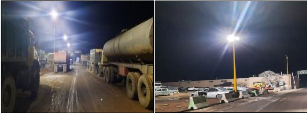
□ تامین روشنایی پل زیر گذر بلوار خلیج فارس