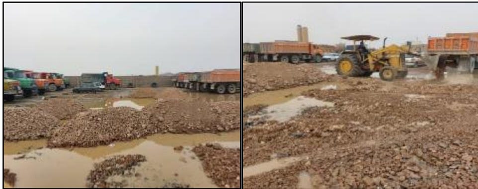
□ پاکسازی معابر از نخاله